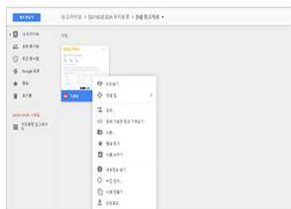
3.업로드한 파일 마우스 오른쪽 클릭 후 공유하기 클릭