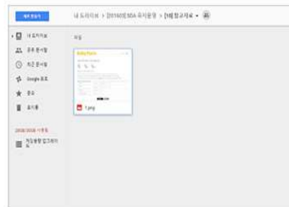
2.개인 드라이브에 출품할 영상 업로드